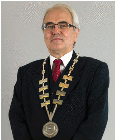
zdroj: Bibliografie dějin Českých zemí

Zdá se vám to nepřehledné a zamotané? To není náhoda, takto nepřehledných a zamotaných pravidel a přijímaných usnesení mnoho. Podstata Evropské unie se nemění. Jen chce ještě více centralizace a dokonce chce sebrat státním práva veta, za podpory mimo jiné prezidenta a vlády ČR.